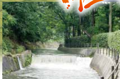
農業を支える巧みな水管理システム(岩出山内川)